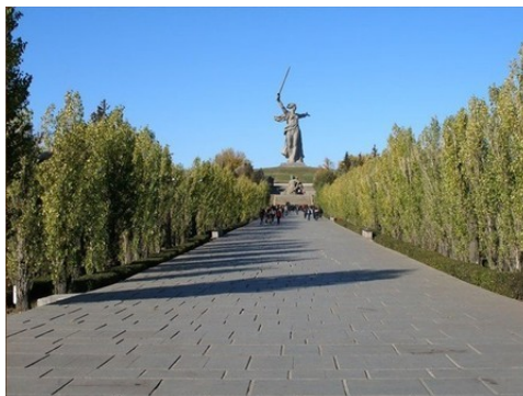
Площадь "Стоять насмерть"