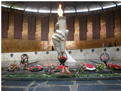
Зал воинской славы