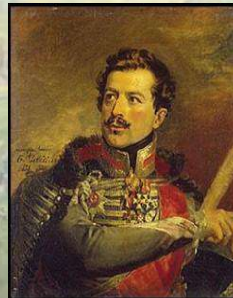
Александр Никитич Сеславин